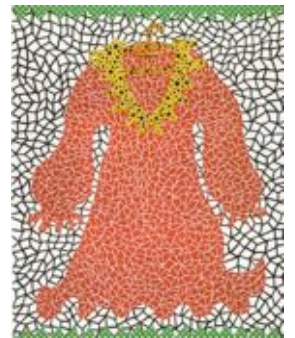
「ドレス」草間彌生 1982年 ed.75 リトグラフ・コラージュ

12月のSekiryu展では、「femininity - 女性性」を定点観測として、さまざまな「彼女」たちの作品、約20点を展示します。この機会にぜひ高覧ください。