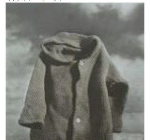
「Portrait of Second-hand Clothes No.3」 オノデラユキ 2008年 ed.35 フォトグラビュール