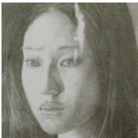
「untitled」諏訪敦 2009年 ed.18 石版画

草間彌生作品に登場する、数々のフェミニンなアイテム — ドレス、靴、帽子、ハンドバックは見るものの心を知らずとおどらせる、プラスのエネルギーに満ちています。いっぽうで、オノデラユキの『古着のポートレート』のシリーズは「時間」、「実在」といった根源的な問いかけが静かになされる作品です。辰野登恵子の、宇宙へ膨張しようとするかのような色とかたち。南桂子の、卵をいだく鳥を思わせるメルヘンチックで、ぼつねんとした世界観。