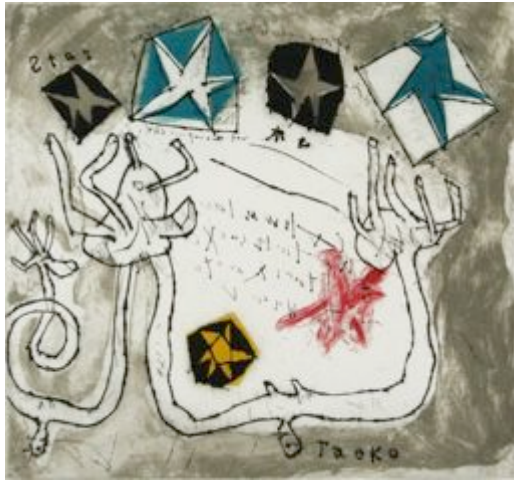
「星をとる女たち」池田満寿夫 1964年 ed.30 銅版画

Selections from the Gallery Sekiryu Collection : Women catching stars